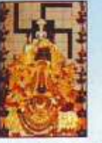
ಯಕ್ಷಿ ಶ್ರೀ ಪದ್ಮಾವತೀರವಿ ಆಮ್ನಿನವರು

॥ ಸ ಪಾತು ಪಾರ್ಶ್ವನಾಥೋಸ್ಥಾನ್ ಯಸ್ತುಹಿಮ್ನುವಭೂಧರಃ | ಸ್ಮಶೇಧಿ ಕೇವಲಂ ಭಕ್ತಭೋಗಿನೀಭಕ್ತ ಧಾರಣಮ್ ॥