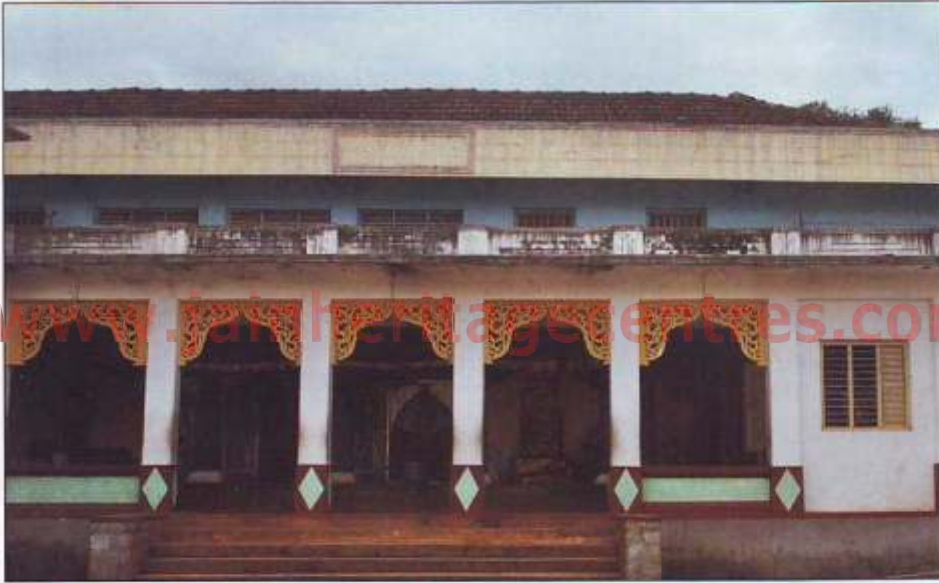
ಶ್ರೀ ಹೊಯ್ಸೂರು ಶೈಲ ಮಠ