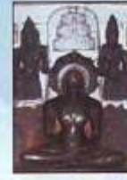
ಭ. ಶ್ರೀ ಪಾರ್ಶ್ವನಾಥಸ್ವಾಮಿ

॥ ಸ ಪಾತು ಪಾರ್ಶ್ವನಾಥೋಸ್ಥಾನ್ ಯಸ್ತುಹಿಮ್ನುವಭೂಧರಃ | ಸ್ಮಶೇಧಿ ಕೇವಲಂ ಭಕ್ತಭೋಗಿನೀಭಕ್ತ ಧಾರಣಮ್ ॥